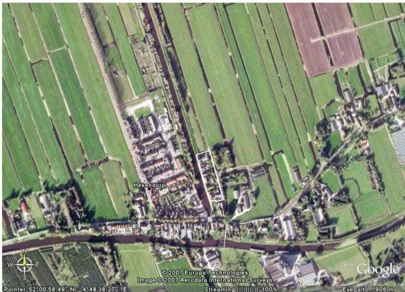
Ligging van de genoemde percelen 192-206 geprojecteerd op een luchtopname uit 2005.