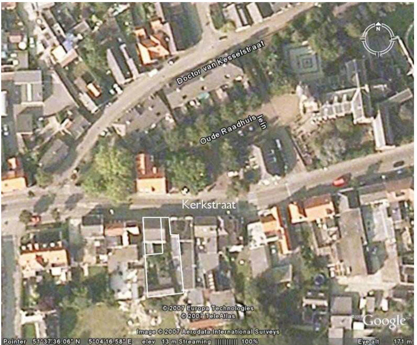
Ligging van de genoemde percelen 353 en 355 geprojecteerd op een luchtopname uit 2005.